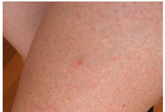
Figur 3. Hudutslag vid zikavirusinfektion.

De allvarligaste formerna av zikavirusinfektion förekommer när viruset överförs till gravida kvinnor. Merparten av infektionerna är uppenbarligen ofarliga för fostret, men i vissa fall kan viruset ge upphov till komplexa neurologiska utvecklingsstörningar hos fostret. Av dem är mikrocefali den mest kända störningen. Mikrocefali har utvecklats